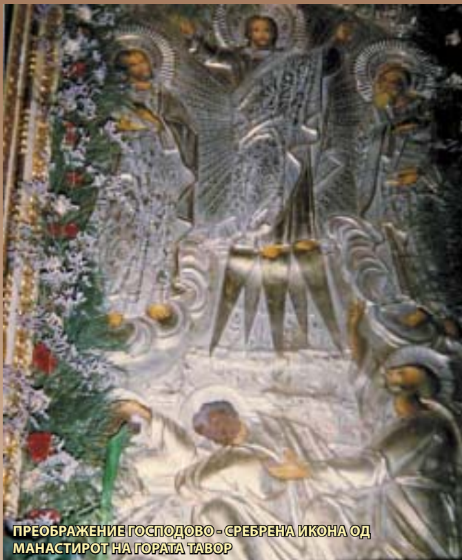
ПРЕОБРАЖЕНИЕ ГОСПОДОВО - СРЕБРЕНА ИКОНА ОД МОНАСТИРОТ НА ГОРАТА ТАВОР