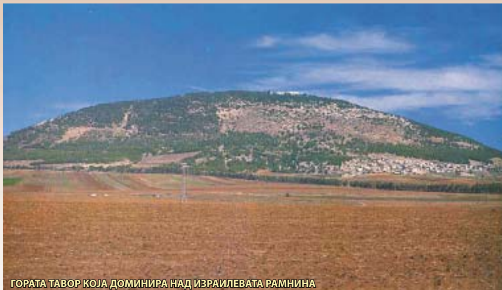
ГОРАТА ТАВОР КОЈА ДОМИНИРА НАД ИЗРАИЛЕВАТА РАМНИНА