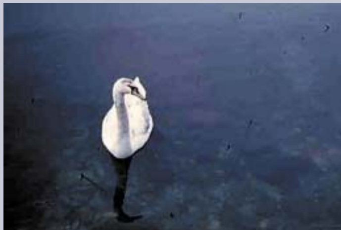
НЕКОГАШ И ЛЕБЕДОТ ГНЕЗДУВАЛ ВО КАТЛАНОВСКО БЛАТО

Пред да почне мелиорацијата, Катлановското блато било попатно собирно одморалиште на птиците преселници.