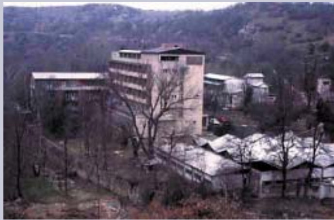
ХОТЕЛСКИТЕ УСЛУГИ СЕ НА РАСПОЛАГАЊЕ ВО ТЕКОТ НА ЦЕЛА ГОДИНА

По земјотресот во 1963 година почнува да се примаат гости во хотелот сместен на десниот брег од реката Пчиња, до местото каде што сè уште се наоѓаат како сведоци остатоците од Турскиот амам, кој бил изграден во 1859 година и се користел сè до ка-