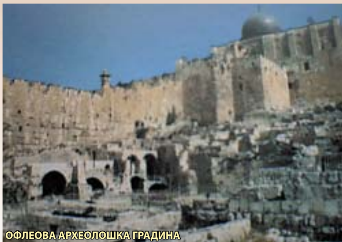
ОФЛЕОВА АРХЕОЛОШКА ГРАДИНА

ширувани по обем и се вршени со посовремени методи. Откриен е слој по слој од историјата, како и многу тајни кои тие во себе ги криеле.