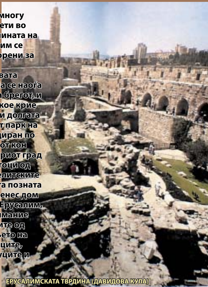
ЕРУСАЛИМСКАТА ТВРДИНА (ДАВИДОВА КУЛА)

Меѓу нив се Офлеовата археолошка градина, која се наоѓа под југоисточниот дел на брегот, и таа претставува место, кое крие податоци за 2.500 години долгата историја; Археолошкиот парк на Давидовиот град, е лоциран по должината на гребенот кон југоисточниот дел на Стариот град и тука се наоѓаат остатоци од кананитските и од израелитските тврдини; потоа Тврдината позната и како Давидова кула, денес дом на Историскиот музеј на Ерусалим, каде што особено внимание привлекуваат градбите од периодот на владеењето на Римјаните, Византијците, крстоносците, мамелуците и Турците.