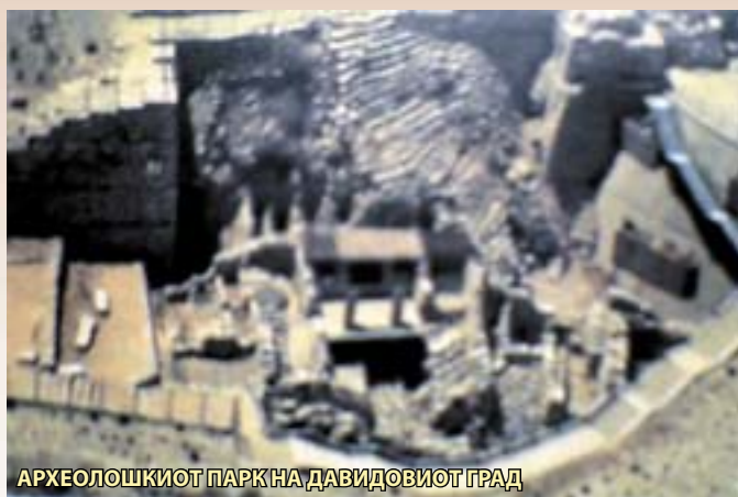
АРХЕОЛОШКИОТ ПАРК НА ДАВИДОВИОТ ГРАД