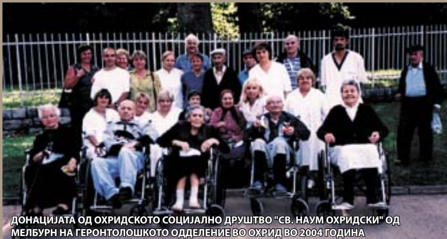
ДОНАЦИЈАТА ОД ОХРИДСКОТО СОЦИЈАЛНО ДРУШТВО "СВ. НАУМ ОХРИДСКИ" ОД МЕЛБУРН НА ГЕРОНТОЛОШКОТО ОДДЕЛЕНИЕ ВО ОХРИД ВО 2004 ГОДИНА

токму од таквите луѓе македонската заедница во Австралија е посиромашна за десетина милиони, што тешко ќе се преболи, но кога фамилијарната чума ќе удри - брат од брат да бега, тоа не знам дали и кога ќе се преболи. Така, сега во Австралија сме исподелени по партии, по цркви, по манастири, по весници, по радија. И сите не чиниме, и тие што молчат и тие што држат предавања по пазарите. А што е најболно немаме свежа струја - крв во заедницата да нè поведе во заедничка насока.