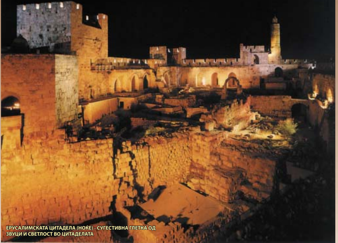
ЕРУСАЛИМСКАТА ЦИТАДЕЛА (НОЌЕ) - СУГЕСТИВНА ГЛЕТКА ОД ЗВУЦИ И СВЕЛОСТ ВО ЦИТАДЕЛАТА

Уште од времето на Ирод Велики, подрачјето околу Цитаделата било посебно утврдено. Градот Ерусалим се протегал кон запад до таа надворешна граница во времето на Иван Хиркан (134-104 г. пр. Хр.), а всушност на овој сид Ирод ги подигнал трите гласовни кули - Фазаел, Хипик и Миријам - и величествениот дворец. Фазаел кулата е наречена според неговиот брат, Хипик кулата според неговиот пријател, а Миријам кулата го добила името по неговата жена.