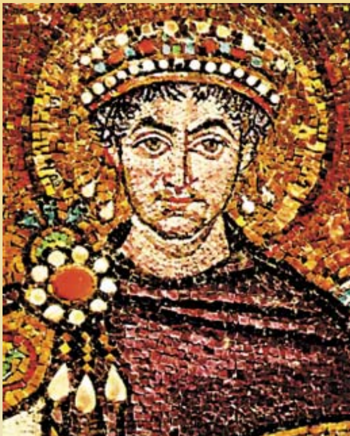
ЛИКОТ НА ЦАР ЈУСТИНИЈАН ОД ВИЗАНТИСКИ МОЗАИК

да повратат дел од територијата во Италија, која им била одземена со нападите на Белизарија. Во војната, на страна на Персија се вклучила и Ерменија. На ис-