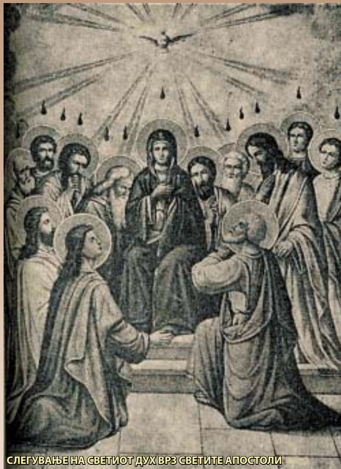
СЛЕГУВАЊЕ НА СВЕТИОТ ДУХ ВРЗ СВЕТИТЕ АПОСТОЛИ

Со благослов на Неговото Високо Преосвештенство Митрополит Европски г. Горазд