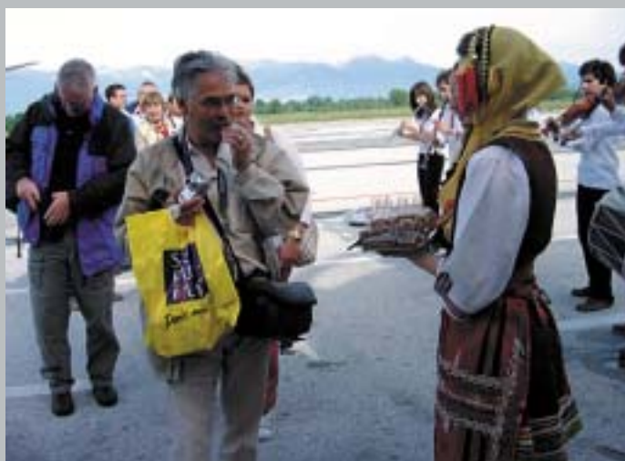
МЛАДИ МАКЕДОНСКИ ДЕВОЈКИ, ОБЛЕЧЕНИ ВО НАРОДНА НОСИЈА, ГИ ПРЕЧЕКАА ГОСТИТЕ СО ЛЕБ И СОЛ, ПО СТАРИОТ МАКЕДОНСКИ ОБИЧАЈ