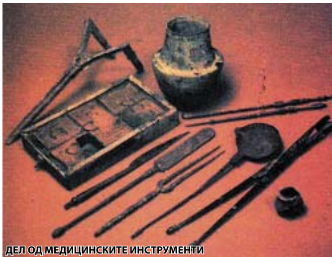
ДЕЛ ОД МЕДИЦИНСКИТЕ ИНСТРУМЕНТИ