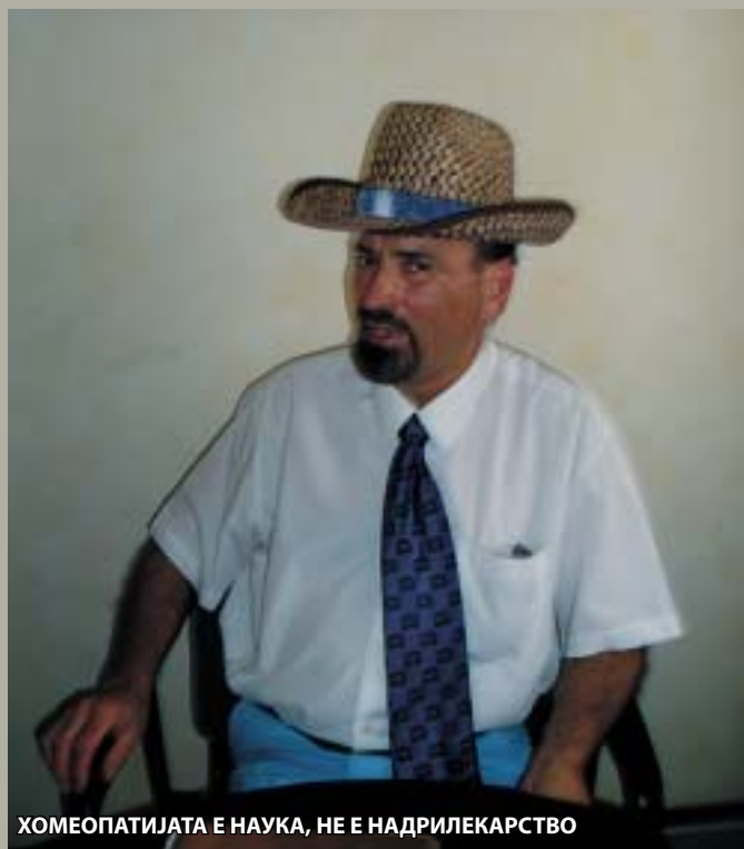
ХОМЕОПАТИЈАТА Е НАУКА, НЕ Е НАДРИЛЕКАРСТВО