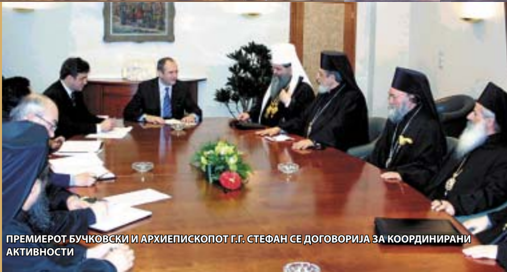
ПРЕМИЕРОТ БУЧКОВСКИ И АРХИЕПИСКОПОТ Г.Г. СТЕФАН СЕ ДОГОВОРИЈА ЗА КООРДИНИРАНИ АКТИВНОСТИ