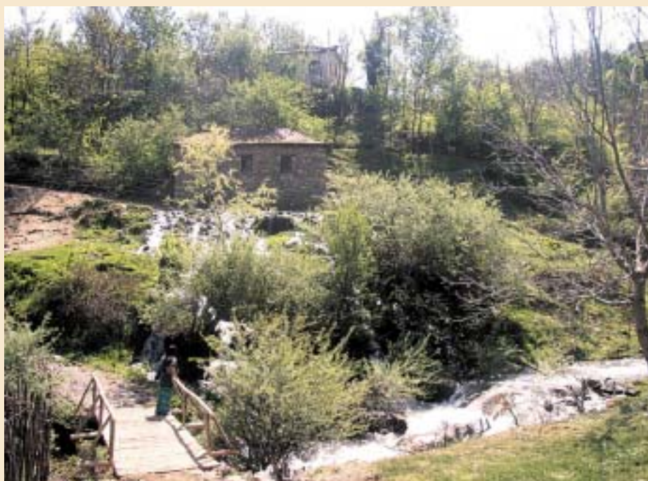
СЕЛО ТРЕБИШТА - ГОЛО БРДО

интегрира во европските институции не е страшно ако се спомнуваат Македонци, Срби, Црногорци, Власи..., се сфаќа дека нема никаква опасност од