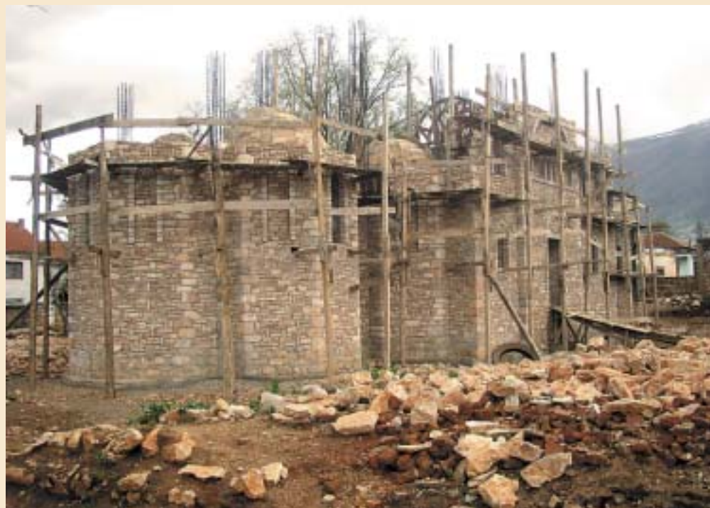
НЕДОИЗГРАДЕНАТА ЦРКВА "СВ. АРХАНГЕЛ МИХАИЛ" ВО СЕЛО ПУСТЕЦ - МАЛА ПРЕСПА

☀️ Премиерот Бучковски во Тирана го отвори прашањето за положбата на македонското малцинство во Албанија и побара албанската Влада да преземе мерки за подобрување на третманот на Македонците во оваа држава, при што истакна: "Гледајќи како Македонија ги заштитува правата на малцинствата и како со Охридскиот договор ние промовираме една поинаква политика, која е многу повеќе од стандардите на Советот на Европа, сметам дека Албанија