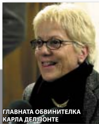
ГЛАВНАТА ОБВИНИТЕЛКА КАРЛА ДЕЛ ПОНТЕ

тие повторно можат да бидат избрани. Судиите ad litem се ангажираат од група од 27 судии, кои исто така, ги избира ООН, со мандат од четири години. Но, тие немаат право на повторен избор. Судиите ad litem можат да ја извршуваат функцијата на МКСЈ само ако на функцијата ги пос-