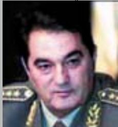
ГЕНЕРАЛ НЕБОЈША ПАВКОВИЌ