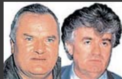
ГЕНЕРАЛ РАТКО МЛАДИЌ РАДОМИР КАРАЌИЌ

влечени обвиненијата додека, пак, 14 обвинети се наоѓаат на слобода.