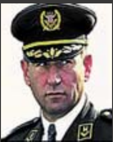
ГЕНЕРАЛ АНТЕ ГОТОВИНА

индивидуалната кривична одговорност и на член 3, кој се однесува на кршењето на законот и обичаите за војување.