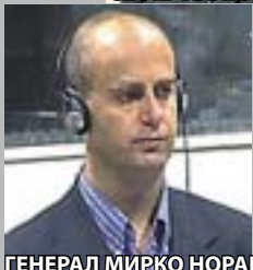
ГЕНЕРАЛ МИРКО НОРАЦ