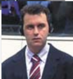
■ Пишува: Кокан СТОЈЧЕВ

Во Судот се вработени 1.248 лица од 82 земји. Буџетот за 2004/2005 година изнесува 271.854.600 американски долари.