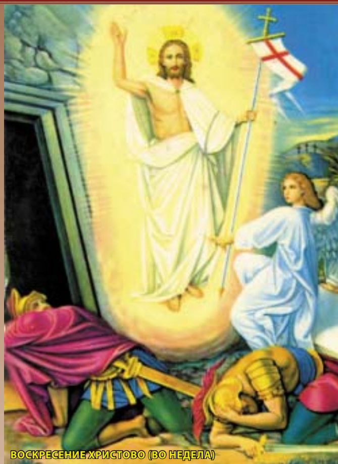
ВОСКРЕСЕНИЕ ХРИСТОВО (ВО НЕДЕЛА)

На Велики Петок се случува најстрашното: мачење, распнување, умирање на Крст. Некои неблагодарни луѓе како да ги забораваат Неговите чуда: слепи прогледуваа, глуви прослушуваа, хроми проодуваа, мртви воскресуваа. Незнабожните луѓе докажаа дека ги сакаат желбите на својата огревована, расипана волја и гласно викаа: "Распни Го, распни!" Лажните обвинија од беззаконите сведоци: "Исус е безбожник, ... Исус