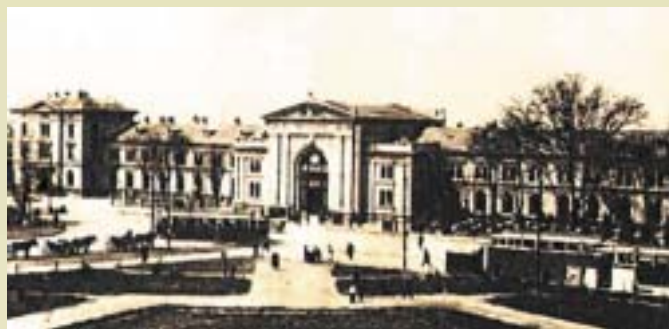
ОФИЦИЈАЛЕН БЕЛГРАД ВО 1924 ГОДИНА