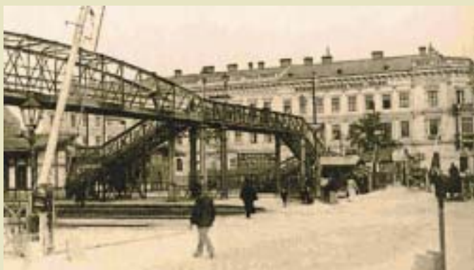
ВИЕНА - СОБИРАЛИШТЕ НА МАКЕДОНСКИТЕ ДЕЛЦИ ВО 1925 ГОДИНА

На крајот на овие војни балканските народи толку пати се измамани од шовинистичките агенти, се прашуваме дали постои можност еден ден да ѝ се стави крај на таквата ситуација, да престанат тие војни што само ги прејудуваат обете завојувани страни и што го прават животот на Балканот неподнослив", вели Новаковиќ.