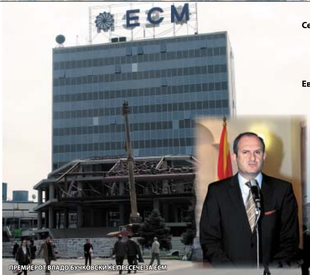
ПРЕМИЕРОТ ВЛАДО БУЧКОВСКИ КЕ ПРЕСЕЧЕ ЗА ЕСМ

Се верува дека нема експерт во Република Македонија кој го прифаќа моделот на Владата за продажба на Електро-стопанство.