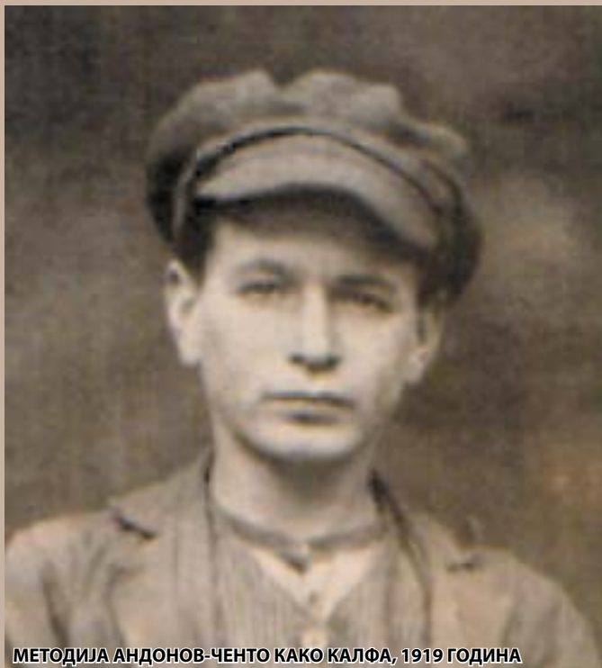
МЕТОДИЈА АНДОНОВ-ЧЕНТО КАКО КАЛФА, 1919 ГОДИНА