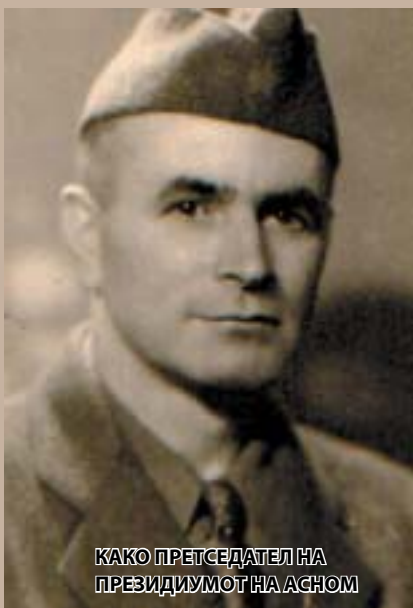
КАКО ПРЕТСЕДАТЕЛ НА ПРЕЗИДИУМОТ НА АСНОМ

ските војни македонскиот народ требало да се бори за ослободување од Отоманското ропство, а по тоа и за обединување. Според него, по Првата светска војна, а особено по Грчко-турската војна, Македонија била поделена на четири дела: Вардарска, Егејска, Пиринска и четвртата - Емигрантска, чии маки ги сознал при посетата на Софија во 1935 година.