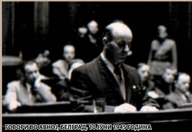
ГОВОР ВО АВНОЈ, БЕЛГРАД, 10 ЈУНИ 1945 ГОДИНА

Но, за жал, сите тие желби и прокламации постепено се напуштиле затоа што не биле во интерес на Комунистичката партија на Југославија, и на верните извршители на таа политика во Македонија, кои почнале да го менуваат текот на настаните, со силата на