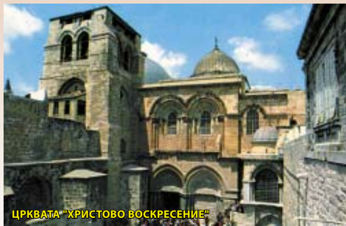
ЦРКВАТА "ХРИСТОВО ВОСКРЕСЕНИЕ"

Дванаесеттата станица е местото каде што е кренат Крстот со распнатиот Господ Исус Христос. На оваа станица се наоѓа местото каде што Христос умрел на Крстот, а таа се нарекува станица на Господовата смрт. Околу него стои стража. На десната страна од Него стои Неговата Мајка, Пресвета Богородица, Мајката на сите нас. Лево од Него се наоѓа Свети Јован Богослов, Неговиот верен ученик. Во близина е прикажана и Мајката Божја, со меч на ле-