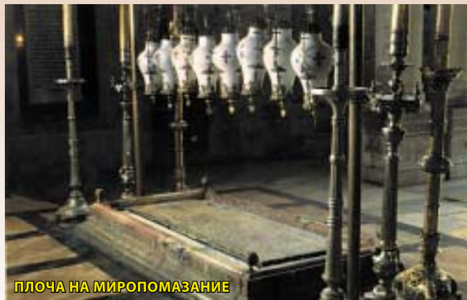
ПЛОЧА НА МИРОПОМАЗАНИЕ

Четиринаесеттата станица е местото каде што се наоѓа Светиот Живоносен Гроб, Гробот на Вечно Живиот Господ, Кој ја победи смртта, го победи сатаната и докажа дека овој земен живот не е крај,