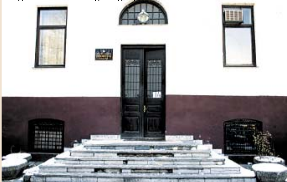
ЗГРАДАТА НА ОСНОВНИОТ СУД КАВАДАРЦИ

власт. Во тој контекст треба да изградиме јавна политика за одбрана, а тоа е градењето доверба, која треба да ја направиме со заедницата. Тоа мора да се направи со цел да изградиме сопствен имиџ и авторитет. Доколку успееме да изградиме сопствен имиџ и се здобиеме со авторитет, ќе имаме поголем кредибилитет заеднички да им се спротивставиме на сите влијанија на извршната власт во РМ. Бидејќи само со доверба од заедницата, можеме да ја вратиме нашата сила со која може да се врати вербата во судството. Во овој транзиционен минат период, во кој извршната власт отворено ја користеше судската власт за да обезбеди социјален мир во земјава, а по осамостојувањето тоа го правеше и преку носењето социјални одлуки, одлуки кои ѝ одговараат на власта, судството не успеа да изгради сопствени авторитети кои ќе го водат напред. Тие ќе му овозможат независност и ефикасност, а авторитетите јасно ќе застанат зад своите модели и ќе се вклучат во измените на законските регулативи, со кои на судството ќе му се овозможи напредок и владеење на правото. Судството е дел од историјата на РМ и претставува извор на националната култура.