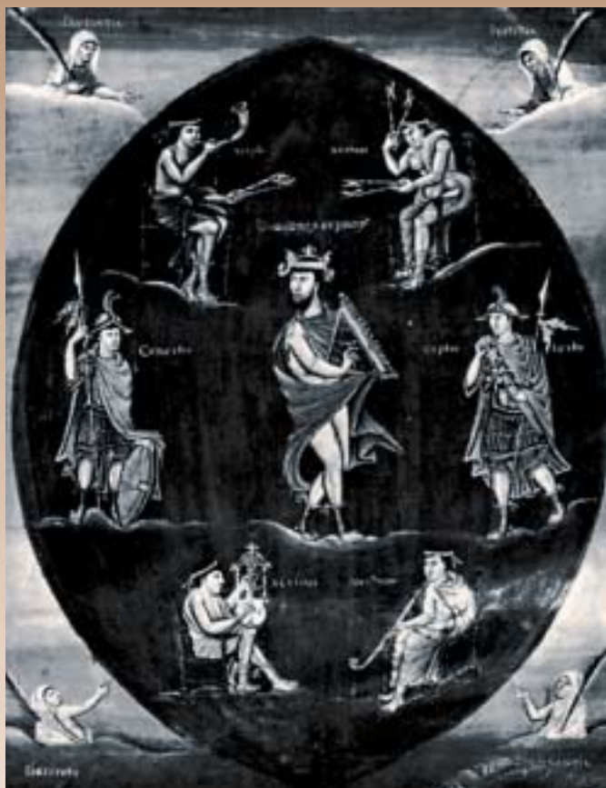
ЦАР ДАВИД СВИРИ НА ХАРФА (ИЛУМИНАЦИЈА ОД ВИВИЈАНСКАТА БИБЛИЈА 843-851)

"Бев најмал од браќата свои и најмлад во домот на таткото мој; ги пасев овците на татко ми... Излегов јас спроти туѓинецот, и тој ме проколна со своите идоли. Но, јас го извадив мечот негов, го обезглавив и ги спасив од срам синовите Израилеви".