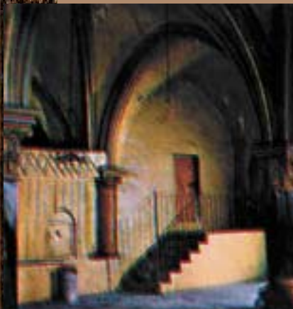
СОБАТА НА ТАЈНАТА ВЕЧЕРА

погоден и нека погине. Во таа борба Урија е убиен. Уриевата жена жалела и плачела за својот маж, а подоцна Давид ја зеде во својата палата и таа му стана жена и му роди син. Но, делото што го направи Давид беше зло пред Господа".