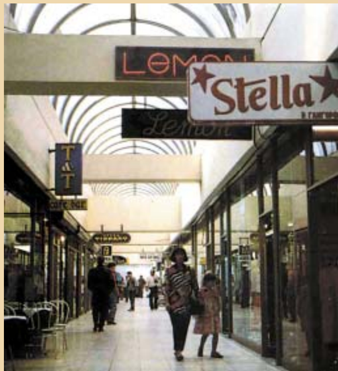
НОВИТЕ МОДЕРНИ ВИЗУРИ

По Втората светска војна, во педесеттите и шеесеттите години, но и подоцна, трафиките беа дел од возбудливите