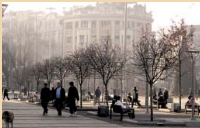
НА НОВИОТ ЦЕНТАР МУ НЕДОСТАСУВА СООДВЕТЕН УРБАН ИМИѢ

Вакви трафики имаше речиси во секое маало, а најмногу на прометните места, пред пасабот "Ароести", на Бит - пазар... Сè уште се сеќаваме на луѓето кои работеа во трафиките, затоа што овие луѓе беа своевидни "волшебници", кај кои можеа да се купат прекрасни и незаборавни нешта.