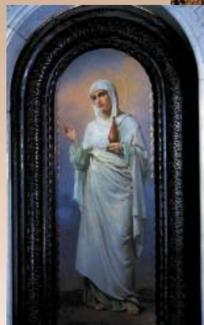
СВЕТА РАМНОАПОСТОЛНА МАРИЈА МАГДАЛЕНА

Православниот манастир Света Марија Магдалена е осветен во 1888 година. На осветувањето присуствувал и братот на императорот, кнезот Сергеј Александрович, поранешен претседател на Палестинското друштво, со својата сопруга великата кнегиња Елисавета. Таа била внука на англиската кралица Викторија, но и сестра на последната руска царица Алек-