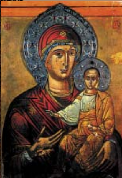
ЧУДОТВОРНАТА БОГОРОДИЧНА ИКОНА