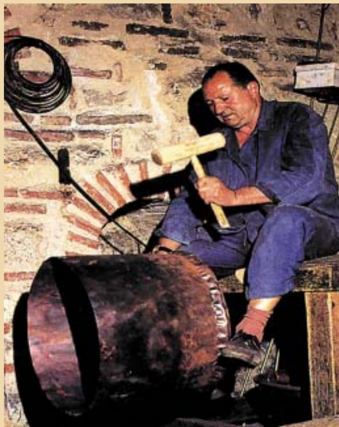
КАЛДРМАТА И ЗАНАОТЕТЕ СЕ УНИВЕРЗАЛЕН ДЕЛ ОД ТРАДИЦИЈАТА