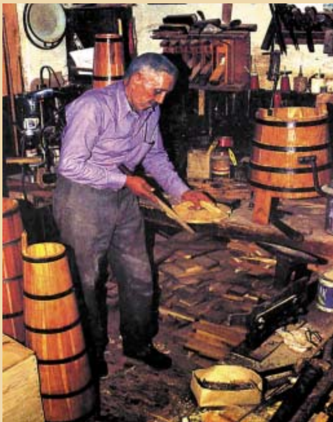
НОВИОТ АРТ БАЗАР ТРЕБА ДА ЈА НАПРАВИ ПОАТРАКТИВНА СКОПСКАТА СТАРА ЧАРШИЈА

кува старото, иако Чаршијата веќе одамна не е тоа што некогаш беше, малубројни сè тие кои ја посетуваат. Која е причината за тоа? Вината за тоа е во нас самите, во нашата негрижа. Всушност, и во овој сегмент како политиката, односно евтината политизација, да проголта сè. Со години за Чаршијата не е направен ни-