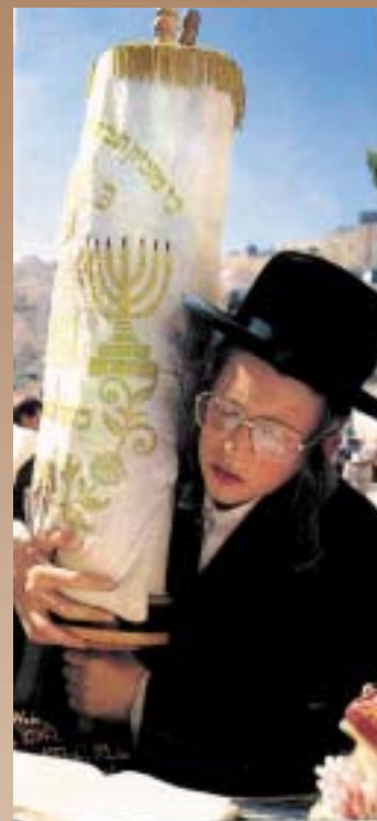
ЕВРЕИН "ХАСИД" НА МОЛИТВА ПРЕД ТОРАТА

Во јужниот дел на Ерусалим ја забележуваме Сионската порта, наречена уште и