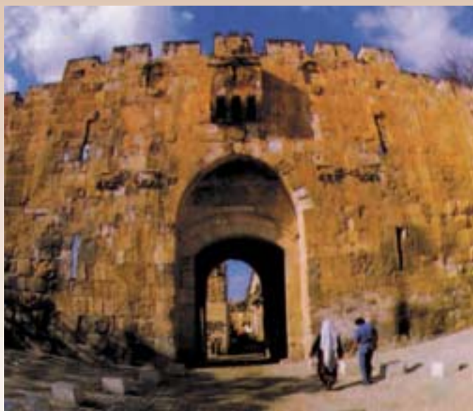
БОГОРОДИЧНА ПОРТА (СТЕФАНОВА ПОРТА)

Со благослов на Неговото Високо Преосвештенство Митрополит Европски г. Горазд