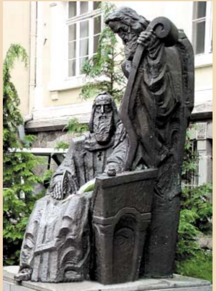
СПОМЕНИКОТ НА КИРИЛ И МЕТОДИЈ

Овде ќе внесам мало до- полнување околу терминот " старословенски јазик ". Де- ка овој јазик бил создаден врз основа на македонскиот говор во околината на Солун - е повеќе од јасно. Поради