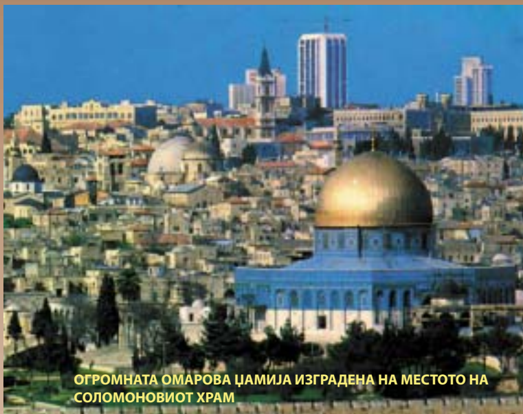
ОГРОМНАТА ОМАРОВА ЦАМИЈА ИЗГРАДЕНА НА МЕСТОТО НА СОЛОМОНОВИОТ ХРАМ