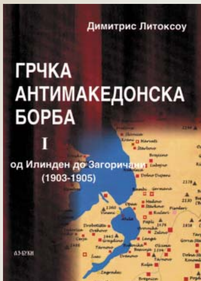
ВО МЕМОАРИТЕ И ВО ДНЕВНИЦИТЕ НА ГРЧКИТЕ МАКЕДОНОМАХИ, БОРЦИТЕ ЗА МАКЕДОНИЈА, ПРВ ПАТ Е ПРИКАЖАНА АНТИМАКЕДОНСКАТА БОРБА

Грчката антимакедонска борба е систематски напор кој грчката држава го вложила на почетокот на XX век, за да му зададе удар на национално-демократско автономистичкото движење на Македонците. Во таа борба грчката држава и националистичката парадржава му станале сојузник на отоманскиот естаблишмент од тоа време. Тие располагале со многу пари и оружје така што можеле да составуваат и да испраќаат чети на македонски територии, каде што не живееле Грци, за да го тероризираат населението и да го запрат процесот на македонската национална преродба. Со насилничко однесување на грчките банди под водство на грчките офицери, тие сееле ужас и смрт низ македонските села, но сепак не успеале да го спречат раз-