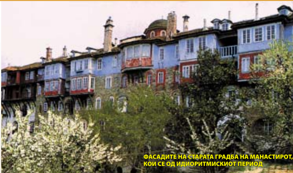
ФАСАДИТЕ НА СТАРАТА ГРАДБА НА МАНАСТИРОТ, КОИ СЕ ОД ИДИОРИТМИСКИОТ ПЕРИОД