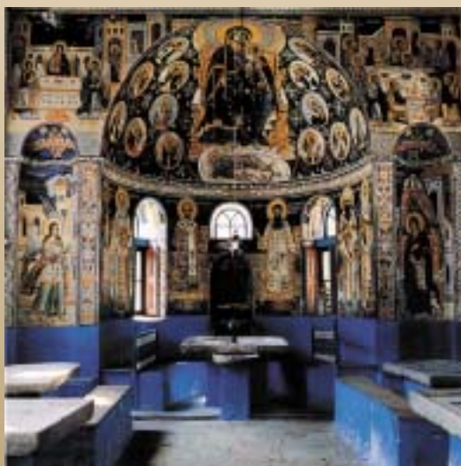
ТРПЕЗАРИЈАТА СО СИДНИТЕ СЛИКИ И МЕРМЕРНИТЕ СИНОБЕЛИ МАСИ

Петте чудотворни икони со непроценлива вредност, сопственост на овој манастир се: Света Богородица Парамитија (Virgin Paramythia), Света Богородица Антифонитрија (Virgin Antiphonitia), Света Богородица Есфигменска (Virgin Esphagmeni), Света Богородица Киториска (Virgin Ktitorissa) и Света Богородица Бематариска (Virgin Beamatarissa) - која потекнува од IX или од X век и е најпочитувана. Нејзиниот празник се слави на 21 јануари, а празникот на манастирот е на 25 март и е посветен на Благовештение. На овој манастир му припаѓаат скитовите Св. Андреј (во близина на Кареја - главниот град на Света Гора) и Св. Димитриј, кој е изграден на еден од блиските ридови.