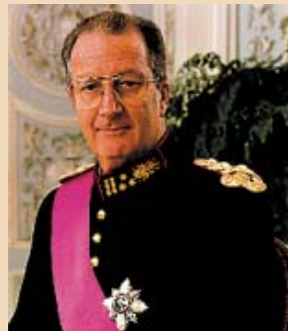
ДЕНЕШНИОТ КРАЛ НА БЕЛГИЈА АЛБЕРТ ВТОРИ (РОДЕН 1934) Е ПОТОМОК ОД ЧЕТИРИЕСЕТТО КОЛЕНО НА ЦАР САМУИЛ

ВЕКЕ НАВЕДЕНИТЕ ПОТОМЦИ НА ЦАР САМУИЛ → ЈОАКИМ ЕРНСТ (1583-1625) → АЛБРЕХТ ОД БРАНДЕНБУРГ АНСБАХ (1620-1667) → ЈОХАН ФРИДРИХ ОД БРАНДЕНБУРГ АНСБАХ (1654-1686) → ЈОХАН ФРИДРИХ ОД БРАНДЕНБУРГ АНСБАХ (1654-1686) → ВИЛХЕЛМИНА КАРОЛИНА (1683-1737) → ФРЕДЕРИК ЛУИС (1707-1751) → ЏОРџ ТРЕТИ ВИЛИЈАМ ФРЕДЕРИК (1738-1820) → ЕДВАРД АВГУСТ (1767-1820) → АЛЕКСАНДРИНА ВИКТОРИЈА (1819-1901) → АЛБЕРТ ЕДВАРД СЕДМИ (1841-1910) → ЏОРџ ПЕТТИ ФРЕДЕРИК ЕРНЕСТ АЛБЕРТ (1865-1936) → АЛБЕРТ ФРЕДЕРИК АРТУР ЏОРџ ПЕТТИ (1895-1952) → ЕЛИЗАБЕТА ВТОРА АЛЕКСАНДРА МЕРИ (родена 1926 г.) - ДЕНЕШНАТА БРИТАНСКА КРАЛИЦА.