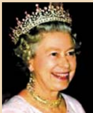
ДЕНЕШНАТА БРИТАНСКА КРАЛИЦА ЕЛИЗАБЕТА ВТОРА (РОДЕНА 1926), Е ПОТОМОК ОД ТРИЕСЕТ И СЕДМОТО КОЛЕНО НА ЦАР САМУИЛ.

бил војводата од Кент и Стратхерн Едвард Август (1767-1820). Тој бил потомок од триесет и второто колено на цар Самуил. Негова ќерка била Александрина Викторија (1819-1901), која станала кралица на Велика Британија и Ирска. Таа била потомок од триесет и третото колено на цар Самуил. Нејзин син бил Алберт Едвард Седми (1841-1910), кој бил крал на Велика Британија и Ирска и император на Индија. Тој бил потомок од триесет и четвртото колено на цар Самуил. Негов син бил Џорџ Петти Фредерик Ернест Алберт (1865-1936). И