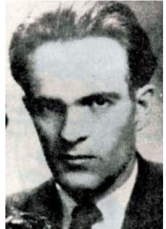
СВОЈ НА СВОЕТО, НИКОЛА ЈОНКОВ ВАПЦАРОВ

Последниов половина век за бугарската политика, наука, литература и публицистика Никола Вапцаров е само Бугарин и голем бугарски поет - револуционер, кој загинал за мајка Бугарија. Непосредно по Втората светска војна сите негови најблиски - мајка му, брат му и сестра му подготвија голем број јавни декларации за своето македонско потекло. Меѓутоа, по XVI пленум на БКП и по промената на Живковата национална политика кон Македонија и Македонците - тие беа доведени во ситуација да мораат да даваат јавни усни и писмени изјави дека Никола се чувствувал Бугарин и дека тие се Бугари, а Македонија била и е бугарска земја. Каков парадокс!