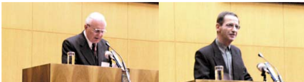
ИНТЕЛЕКТУАЛНИОТ СВЕТ ОДРЖА СВЕЧЕНА БЕСЕДА ВО ЧЕСТ НА ВАПЦАРОВ