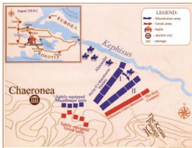
БИТКАТА КАЈ ХЕРОНЕЈА

СТОЈЧЕВ: Спомнав дека еден од условите за опстојување на воената историја како посебна наука е создавањето воена теорија, која се создава со изучување на разни документи, кои наставале или се пишувале во време на воените настани или непосредно понив. Тежи-