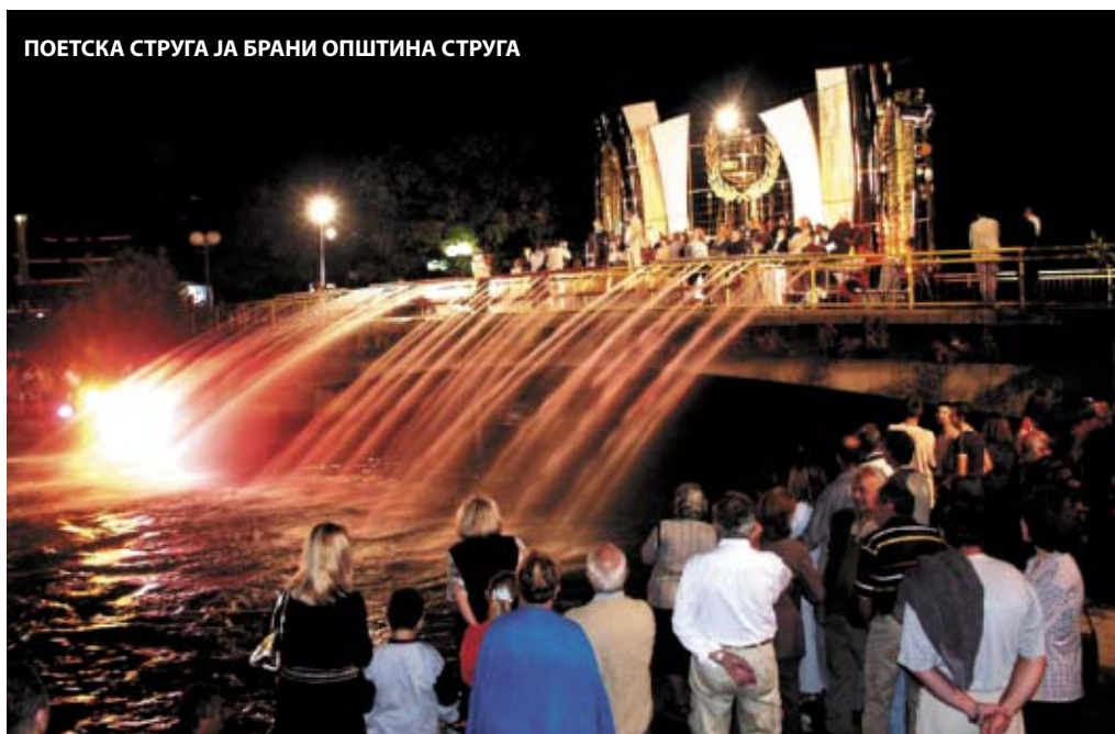
ПОЕТСКА СТРУГА ЈА БРАНИ ОПШТИНА СТРУГА

Кризниот штаб за останок на Струга во проширен состав донесе одлука сепак да се почитува усвоената Декларација и меѓу другото да се бојкотираат и сите културни манифестации. Градот ќе го бојкотира одржувањето на поетскиот фестивал Струшки вечери. Одговорот на Управниот одбор на Фестивалот по повод најновата одлука гласи: "Струшките вечери на поезијата ќе се одржат во предвидениот термин од 25 до 30 август годинава, бидејќи најважен културен приоритет во овој момент за Република Македонија е одржувањето на 43-годиш-