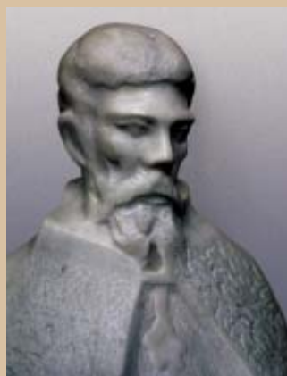
СВ. НАУМ ОХРИДСКИ