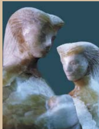
ДВА ЖЕНСКИ ПОРТРЕТИ

духот, на она личното, персоналното, да се зачува, да остане со главата над матната вода на времето во која, без прекин тонат и засекогаш исчезнуваат, прекриени од тешките бранови, илјадници луѓе, животни, суштества, сништа и амбиции".