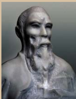
СВ. КЛИМЕНТ ОХРИДСКИ