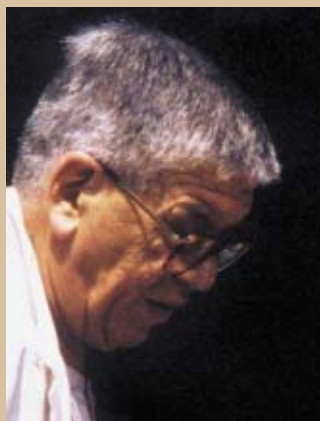
СКУЛПТОРОТ ТОМЕ СЕРАФИМОВСКИ