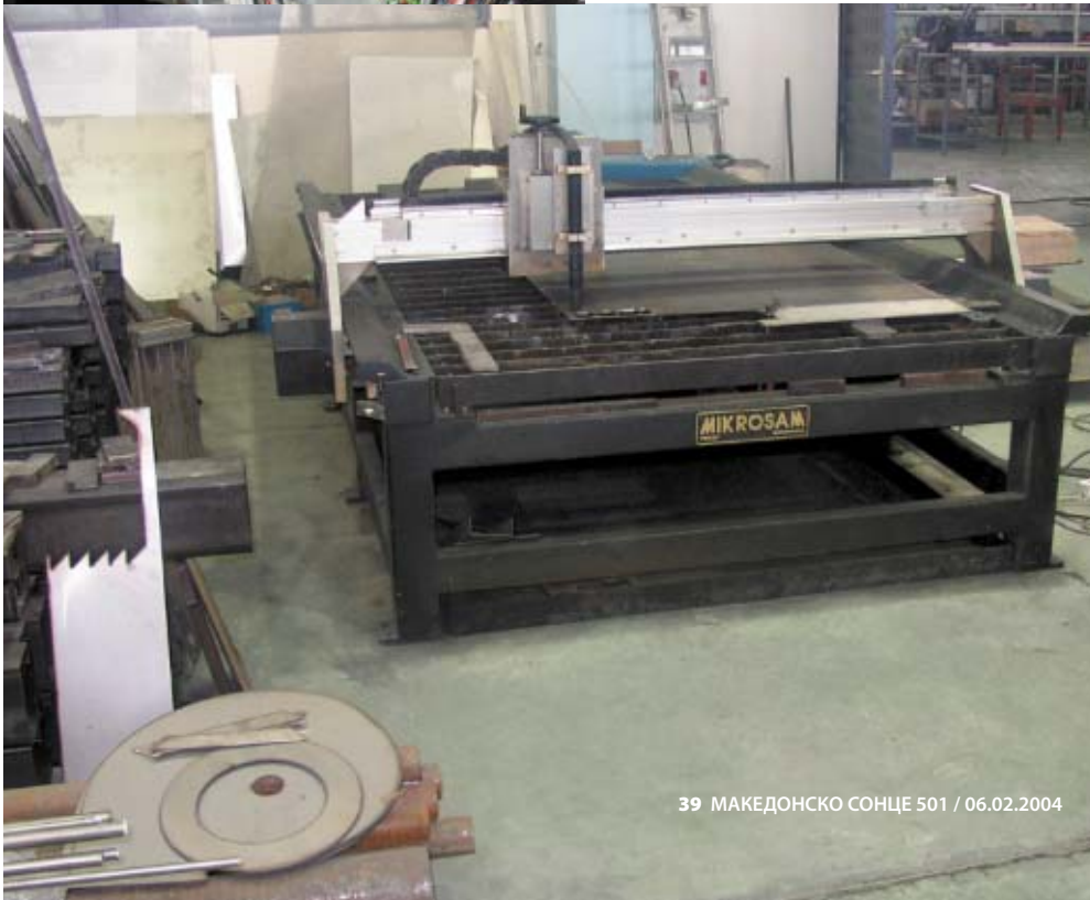
ЕДНА ОД МАШИНИТЕ

реноме, таа претставува единствено препознатливо име од Македонија во глобални рамки и во секторот каде работи. Скоро сето свое производство го пласира на странски пазари. Во досегашното работење не е вклучена во ниту една незаконска активност. Не постојат какви било пријави за кривични или прекршочни дела било од подрачјето на надворешно трговско работење било од подрачјето на економско финансиско работење.